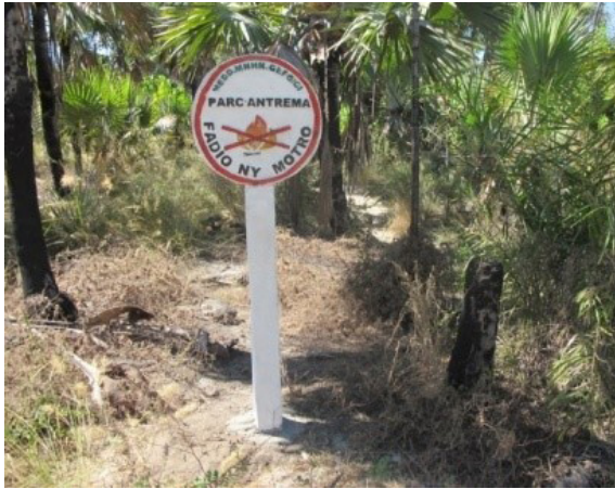
Panneaux de sensibilisation de feux