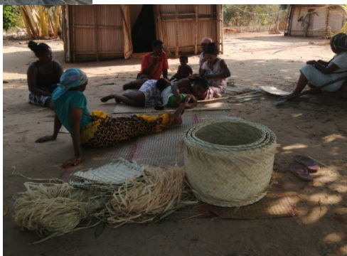
Sensibilisation à Ambalarano