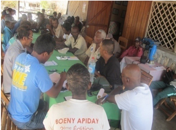
Réunion Patrouilleurs avec le représentant de RASMUSSEN

Une nouvelle stratégie été mise en place grâce à l'appui RASMUSSEN afin de diminuer la pression sur les feux dans l'aire protégée Antrema. Les patrouilleurs vont installer cinq tours (5) de sentinelles pour guetter le point d'origine des feux. L'objectif est de diminuer les propagations des feux, si on les détecte tôt.