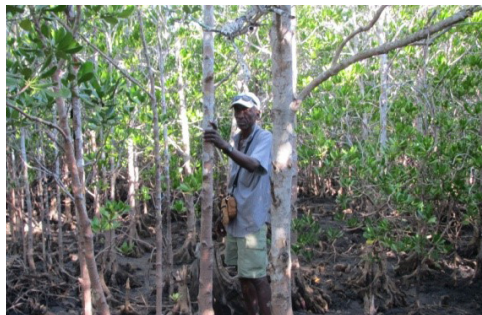
Patrouille dans les mangroves