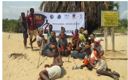
Les participants qui ont nettoyé le rivage d'Antrema Andafiroa