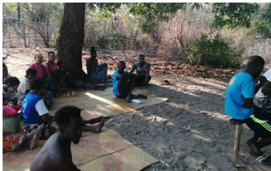
Sensibilisation à Antrema

- Rappeler les techniques de la gestion des feux.