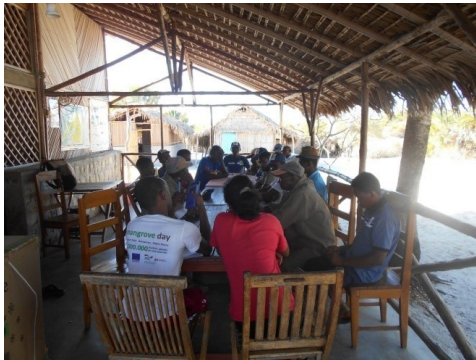
Renforcement de Capacité des patrouilleurs

Durant ce troisième trimestre, une descente a été effectuée par l'équipe du Canforêt Mitsinjo dans la NAP Antrema. L'objectif de la mission est de faire un renforcement des capacités de l'entité locale tel que les VNA, les VOI, les KMDT et les Agents au Camp de base I sur les méthodes pratiques de patrouille et contrôle.