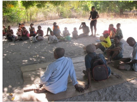
Les participants durant l'évaluation de TGRN Ampampamena