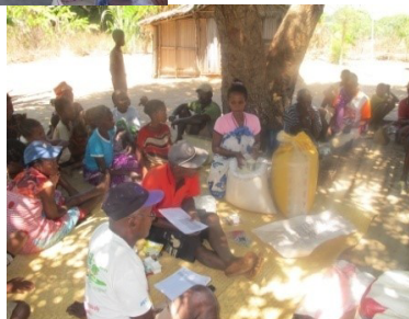
Distribution des donations à AMBALARANO