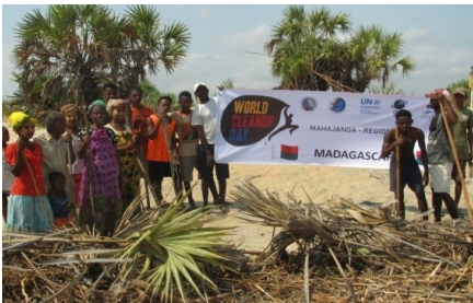
Les participants qui ont nettoyé le rivage d'Antrema Aranta