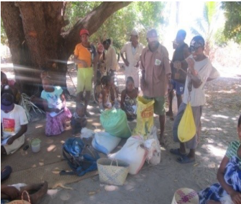
Distribution des donations à AMPAMPAMENA

Face à cette situation de pandémie dans la Région Boeny, FAPBM et MNHN ont fait une contribution pour amortir les impacts du COVID-19. En plus de la sensibilisation sur la pandémie, une dotation en nature a été réalisée pour les communautés locales de la NAP Antrema les plus vulnérables.