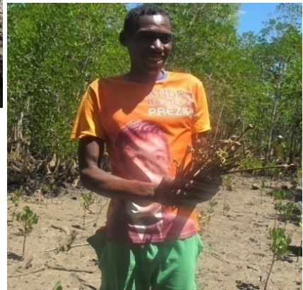
Collecte de propagule