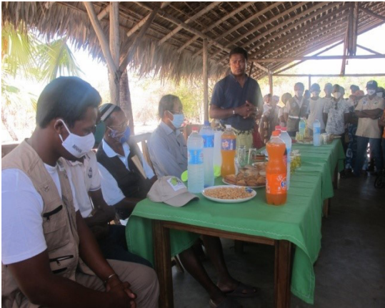
Discours du Gouverneur

La cérémonie a eu lieu au camp de Base I Antrema Aranta qui est animée par les différentes associations des femmes venant des différents secteurs. Le message principal est orienté surtout sur le contrôle de feux et la restauration d'endroits dégradés ainsi que la migration.