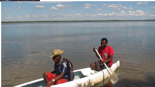
Patrouille sur mer