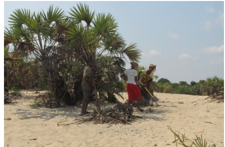
Nettoyage de la plage d'Antrema Aranta