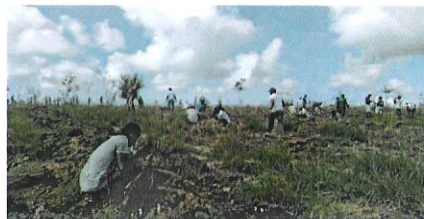
Les participants au moment du reboisement

Le reboisement est devenu une des priorités du gouvernement pour lutter contre les effets néfastes du changement climatique. Il est aussi un moyen pour les responsables aussi bien du secteur privé que ceux du secteur public, de contribuer dans l'atteinte de l'objectif qui consiste à refaire de Madagascar une île verte.