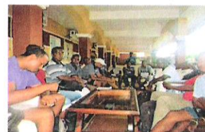
Réunion de coordination régionale MIHARI