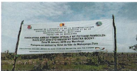
Banderole de la campagne officielle

La période de reboisement pour 2017-2018 a débuté le 19 Janvier 2018 pour toute l'étendue du territoire national.