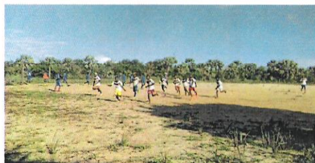
Tournoi de football

Pour la célébration de la journée mondiale des zones humides, l'Aire Protégée Antrema a organisé un évènement culturel et sportif spécial. Pour cela, un tournoi de football a été fait, un radio crochet concernant l'Aire Protégée pour les élèves, et des plantations de propagules des palétuviers dans le village de Bako. 3 000 plantules ont été mises en terre. Des matériels scolaires et des bonbons ont été distribués pour les enfants et des coupes pour les vainqueurs du tournoi.