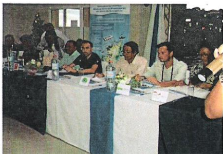
Signature de la Charte MIHARI

La réunion a été ouverte officiellement par le président du bureau national MIHARI. La première journée a été consacrée au partage des actualités et projets en cours des organisations membres et des représentants des communautés. Cette journée a également permis aux participants de discuter des activités du réseau prévues pour