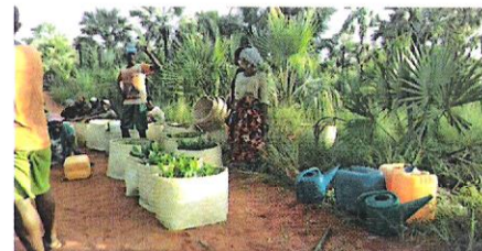
Les communautés locales avec les plants d'Acacia le jour de reboisement

Reboiser est un engagement. C'est un devoir et de la responsabilité de chacun de participer au reboisement pour les générations futures.