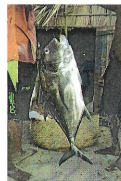
Caranx ignobilis, une prise par les pêcheurs à Antrema

La Caranx ignobilis , une espèce de poisson marin de la famille de Carangidae, est une très grande carangue argentée ou sombre à presque noire, parfois avec des bandes foncées le long du dos. C'est un poisson de grande taille pouvant atteindre 170 cm de long.