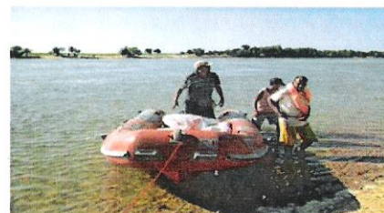
Débarquement à Antsikiry

Une patrouille a été effectuée par le chef cantonnement de Mitsinjo et son collaborateur dans l'AP Antrema durant ce premier trimestre.