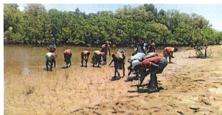
Plantations des propagules de palétuvier