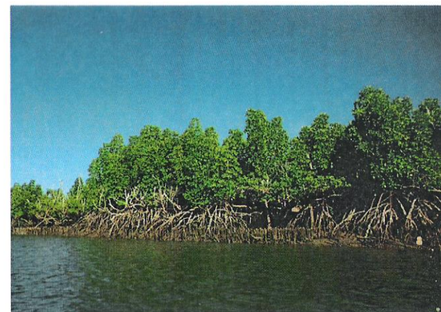
Mangrove d'Ambolobozy, sud de l'Aire Protégée Antrema

Caranx ignobilis : carangue à grosse tête