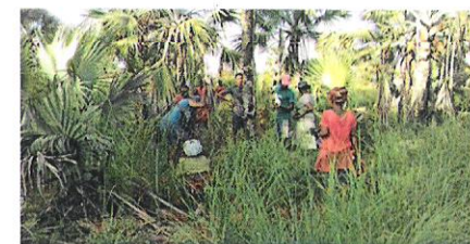
Les communautés locales en pleine plantation