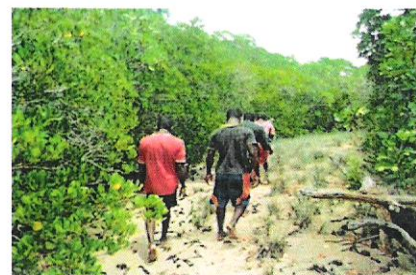
Patrouille communautaire dans le sud de l'Aire Protégée

Les intervenants dans cette rubrique sont les VNA (Vaomieran'ny Ala), les Aro motro (KMDT), les 02 VOI (Ambanjabe et Ampampamena), le Cantonnement de Mitsinjo (CEEF), les agents de la pêche Mitsinjo et les Agents du site bioculturel. 24 patrouilles ont été réalisées.