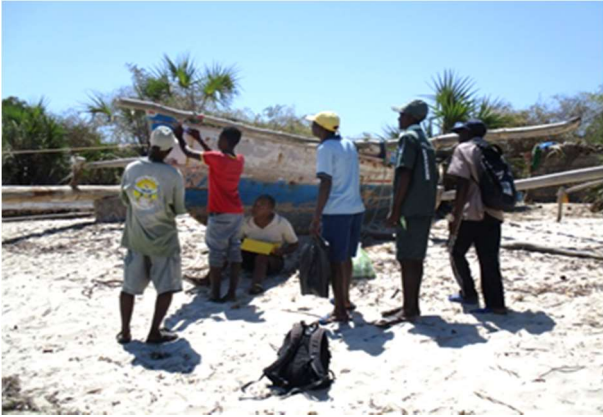
Marquage de pirogue à Ambarokely