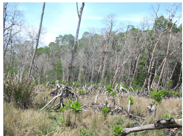
Des palétuviers morts sur pieds

Malheureusement, des menaces et pressions naturelles pèsent sur plus de 50 Ha de ces mangroves. Ces mangroves se situent à Ampamanta à côté du village de Bako. En effet suite aux cyclones de 2015 et aux marées d'équinoxe de 2016, deux chenaux ont été ensablés : l'échange entre eau de mer et eau douce ne se fait plus. Ces mangroves étaient en risque imminent de disparition à l'instar des mangroves du village d'Antrema Aranta en 2005.