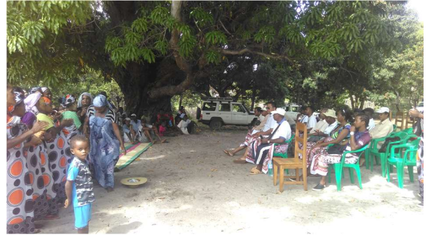
Des différents discours dans le Doany à Antrema

Dans cette célébration, les invités avec les communautés locales ont participé à une restauration des mangroves dans le village de Bako avec 1985 propagules ont été ainsi plantés.