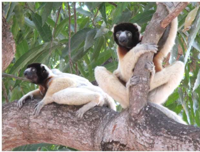
Propithecus coronatus sur le manguiier au Doany

Classé comme espèce en voie de disparition, le propithèque couronné ou sifaka couronné est un lémurien de la famille des INDRIDAE. Formant des petits groupes de 2 à 8 individus dans les forêts sèches, les forêts galeries et les mangroves, il est reconnaissable par son pelage blanc crème, sa