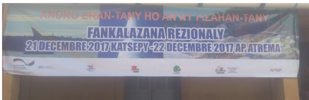
Banderole de la célébration

Le tourisme durable, outil de développement