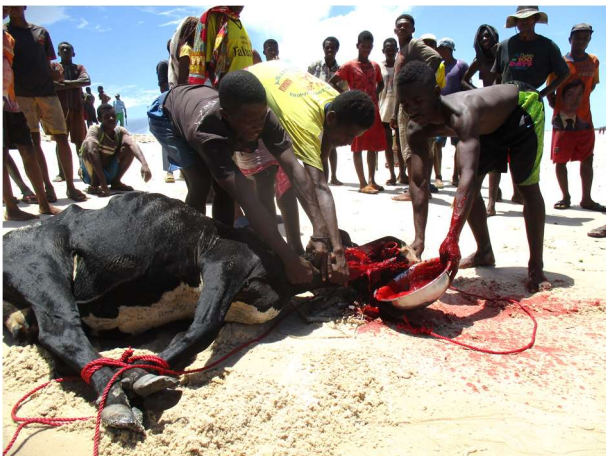
Un zébu tué pour le joro

Le site Bioculturel d'Antrema figure parmi les Aires Protégées terrestres du système SAPM, et plus de la moitié des zones limitrophes est bordée de mer. Les mangroves figurent parmi les écosystèmes qui occupent ces zones limitrophes. Conscient de l'importance de ces écosystèmes et des services qu'ils rendent, deux transferts de gestion ont été effectués avec deux VOI bien structurés et fonctionnels, responsables de patrouille et gestion. Ce Site Bioculturel héberge plus de 1000 personnes regroupées en 250 ménages dont plus de 80% sont des pêcheurs et vivent de la mer, des mangroves (zone de nurserie et habitats de crustacés dont les crabes de mangroves).