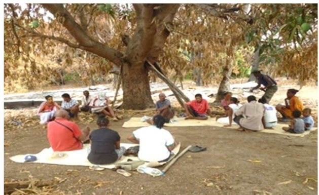
Sensibilisation à Belemoka

Une patrouille a été effectuée par le Chef Cantonnement de Mitsinjo dans la NAP Antrema durant ce dernier trimestre. Les localités suivantes ont fait l'objet des visites :