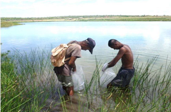
Enrichissement en alevins du lac d'Ambalarano

Une patrouille a été effectuée par l'équipe de la Direction régionale de la pêche durant le dernier trimestre de 2017.