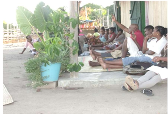
Sensibilisation à Kapahazo

Une information et communication sur l'obligation de reboisement mentionné dans le DINABEN'I BOENY MIRAY DIA a été effectuée dans ces villages visités.