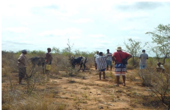
Patrouille à Andavakabe