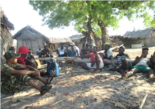
Sensibilisation à Antsikiry