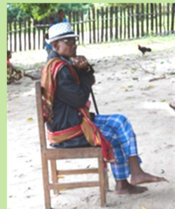
Prince Tsimanendry d'Antrema

Face aux enjeux environnementaux, l'action éducative devient une question vitale et s'avère essentielle pour l'émergence de citoyens écologiquement responsables. L'éducation environnementale encourage des comportements et des valeurs responsables en faveur de la préservation de l'environnement.