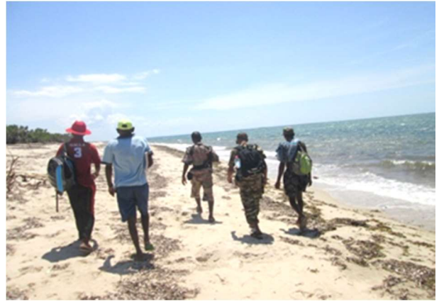
Patrouille à Ambanjabe