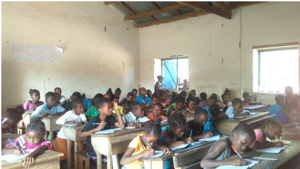
En plein cours d'éducation environnementale

L'acquisition du réflexe environnemental par le public en général est un défi pour la gestion de l'environnement. L'éducation environnementale constitue ainsi un des outils utilisés pour développer ce réflexe environnemental.