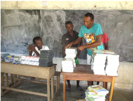
Remise des kits scolaires à Antrema

Comme la commune rurale de Katsepy n'a pas été touchée par les vacances de peste, l'éducation dans le Site Bioculturel d'Antrema s'est poursuivie normalement. Des remises de kits scolaires pour l'année scolaire 2017-2018 ont été effectuées dans les deux EPP et trois écoles de l'AP Antrema. Ces kits ont été distribués aux élèves depuis la maternelle jusqu'à la classe de T5 en Octobre dernier. La dotation en kits scolaire vise à favoriser l'accès à l'éducation et permet aux parents d'envoyer leurs enfants à l'école.