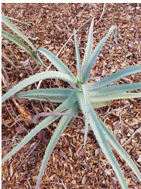
Aloe divaricata dans la forêt dense sèche d'Antrema

Aloe divaricata : une plante connue par ses usages thérapeutiques